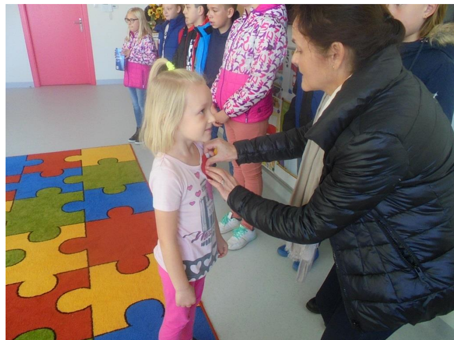
Za prawidłową odpowiedź otrzymały biało-czerwony kotylion.