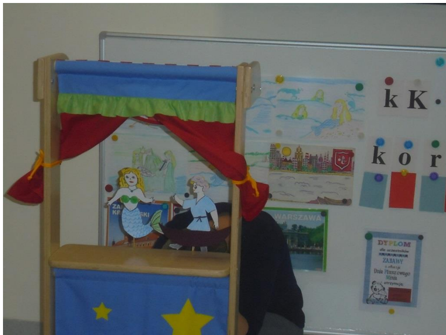
Dzieci poznały legendę powstania naszej stolicy „Wars i Sawa”.

Stosując teatrzyk kukiełkowy, czytanie przez nauczyciela, rodziców, systematycznie poznawały legendy związane z ważnymi miastami naszego kraju: Warszawy, Krakowa – „Wars i Sawa”, „Bazyliszek”, „Złota kaczka”, O smoku wawelskim, „O trębacz z wieży Mariackiej”, „O Wandzie co Niemca nie chciała” i wiele innych. Ponadto zaznajomiły się z niektórymi zabytkami głównych miast. Zdobytymi wiadomościami z zakresu historii mogły się pochwalić biorąc udział w quizie „Co wiemy o Polsce?” przygotowanym przez dzieci ze świetlicy w Szkole Podstawowej w Widawie.