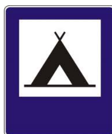
7. pole namiotowe