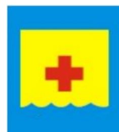
8. punkt medyczny