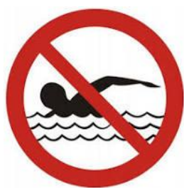
2. zakaz kąpieli