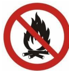
4. zakaz rozpalania ognisk