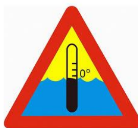
3. zimna woda